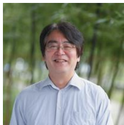
広井良典氏 京都大学こころの未来研究センター 教授

1961年岡山市に生まれる。1984年東京大学教養学部卒業（科学史・科学哲学専攻）、1986年同大学院総合文化研究科修士課程修了。厚生省勤務をへて、1996年より千葉大学法経学部（現・法政経学部）助教授、2003年より同教授、この間（2001・02年）マサチューセッツ工科大学（MIT）客員研究員。2016年より現職。専攻、公共政策、科学哲学。