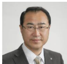
宮坂尚市朗氏 北海道厚真町長

1979年日南市生まれ。九州大学工学部卒業後、宮崎県庁職員を経て、2013年4月に九州最年少市長として日南市長就任、現在3期目。民間企業との積極的なコラボレーションを推進し、「日本一組みやすい自治体」、「日本の前例は日南が創る！」をキャッチコピーに掲げ、ベンチャー企業並みのフットワークの軽さを売りに事業展開を行う。シャッター通りだった油津商店街の再生、IT企業やクルーズ船の誘致、古民家をリノベーションし旅館に再生する取り組みなどが、地方創生の先進事例として注目されている。